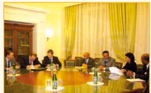
Fifampiraharana tany Rosia ny taona 2010