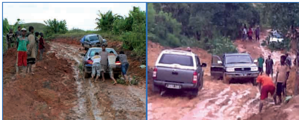
Sady fiakarana mideza no fotaka mandrevo

Nandritra ny iraka nataon'ny Tahirim-bolam-panjakana farany teo dia ora dimy be izao no lany teo amin'ny « déviation » tamin'ny lalana mampitohy an'Iroandro sy Manakara. Tapaka tanteraka ny lalana noho ny fihotsahan'ny tany vokatry ny orana nikija taorian'ny fandalovan'ny rivodoza Giovanna. Voatery nasiana « déviation » mirefy 3 km mba nahafahan'ireo fiara marobe nanohy ny lalany. Tranga mety miseho ny fahasarotan'ny lalana toy izao rehefa mamita iraka.