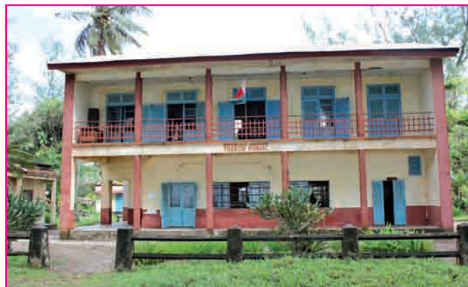
Ny biraon'ny TG Manakara

fitantanana amin'izao fotoana izao ny fanofanana mpiasa afaka miasa avy hatrany. Misy ireo « Contrôleurs du Trésor » sy « Comptables du Trésor » 40 izay eo an-dalam-pamitana fiofanana amin'izao fotoana izao. Tsy hisy hijanona aty amin'ny foibe izy ireo fa halefa hiasa avy hatrany any amin'ny « réseau comptable » ka anisan'ny hahazo amin'izy ireo ny TG Manakara. Ny fanofanana mpiasa dia mbola hitohy hatrany. Nampitaraina ny mpiasa ihany koa ny fahanteran'ny trano fiasana sy ny fampitaovana, indrindra ny fitaovana informatika. Tranainy tokoa ny trano fiasan'ny TG Manakara satria efa talohan'ny taona 1938 no nanorenana azy. Tsy manara-penitra intsony ny « caisses ». Maro dia maro ireo antontan-taratasy na ny « archives » efa tsy ampiasaina intsony ka tokony ho dorana. Ravan'ny rivodoza ny trano tokony nametrahana azy ireo. Namaly ny