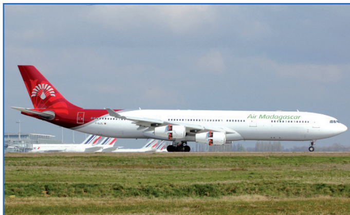
Toy izao ny Airbus A340-300

Amin'ny maha mpisolotena ny Fanjakana tompon'ny petrabola eo anivon'ny Air Madagascar (actionnaire) ny Tahirim-bolam-panjakana dia nanara-maso akaiky ny fanapahan-kevitra rehetra manodidina ny fividianana ity fiaramanidina vaovao ity izy. Tanjon'ny filankevi-pi-