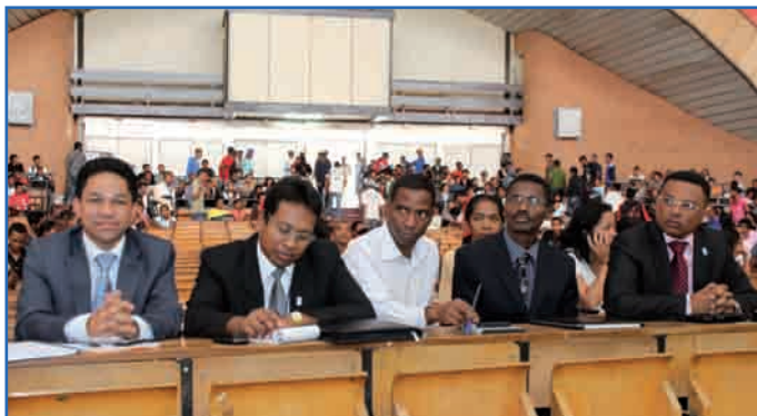
Ireo tompon'andraikitra ny Tahirim-bolam-panjakana niatrika ny fihaonam-ben'ny mpianatra sy ny mpampianatra SECES teny amin'ny Oniversite

T aorian'ny fitokonana teny anivon'ny Oniversite dia natanteraka fifampidinihana arahina adihevitra ny fikambanana pedagojikan'ny mpianatra. Voasa tamin'izany ireo tompon'andraikitra ny Tahirim-bolam-panjakana. Niadiana hevitra ny mahakasika ny fanatsarana ny fampianarana eny amin'ny Oniversite. Samy nanome ny heviny mikasika ny toe-draharaha nisy ireo izay voasa ary nandroso vahaolana. Tamin'ny fandraisam-pitenenan'ny Tale Jeneralin'ny Tahirim-bolam-panjakana dia nampahafantatra ny anjara asan'ny Tahirim-bolam-panjakana izy amin'ny maha tomponandraikitra an'ity farany amin'ny fitantanana ny volam-bahoaka sy ny fikirakirana izany, nialohan'ny niresahany ny eny amin'ny Oniversite. Lavitrisa maro (1700 lavitrisa MGA), hoy izy ny vola tsy tafiditra tao amin'ny kitapom-bolam-panjakana hatramin'ny faran'ny taona 2011, satria ny famatsiambola avy any ivelany izay mitentina eo amin'ny 200 tapitrisa Dolara eo sy ny hetra isan-karazany dia tsy niditra araka ny tokony ho izy avokoa. Na izany aza, niezaka hatrany ny Tahirim-bolam-panjakana nitady ny fomba rehetra namenoana ny tsy