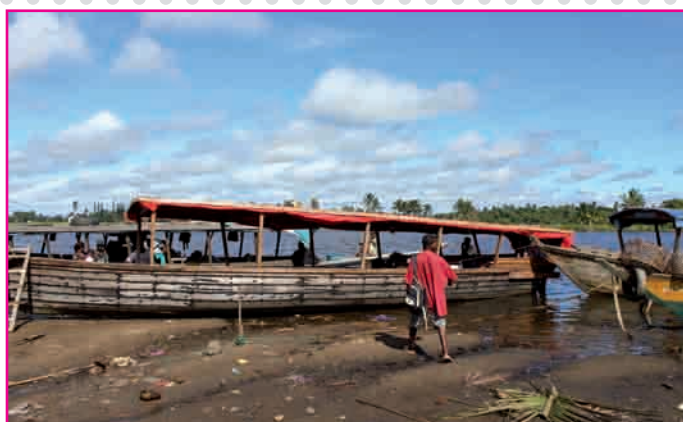
Ny Kanoto, fitaovam-pitaterana any an-toerana

vahaolana maharitra amin'ny fiarovana ny volam-bahoaka sy hanalana fahasahiranana ny PP. Efa simba tanteraka ihany koa ny trano iasana ary efa tafiditra ao anatin'ny fandaharan'asa 2012 ny Tahirim-bolam-panjakana ny hanorina trano fiasana sy fonenana vaovao manara-penitra mamaly ny fepetra rehetra mifanaraka amin'ny politika ankapoben'ny Tahirim-bolam-panjakana ny PP Nosy Varika.