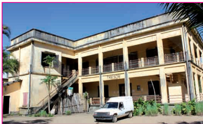
Efa simba ny tranon'ny TP Mananjary

Ny olana eo amin'ny tsy fahampian'ny mpiasa moa dia ho voavaha tsy ho ela satria efa manaraka fiofanana ankehitriny ireo « comptables » sy « contrôleurs » vaovao izay ho avy hanatevin-daharana ireo mpiasa any amin'ny faritra.