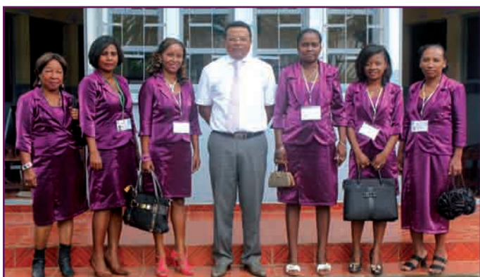
Les dames de la TG Farafangana avec le DGT