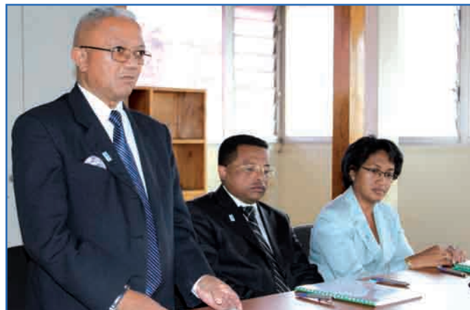
Famindram-pahefana teo amin'ny DDP taloha (sisiny ankavia) sy ny DDP vaovao (sisiny ankavanana)