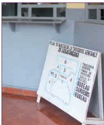
Dès que vous entrez, le plan de masse vous guide

La transparence dans les procédures constitue un des éléments essentiels de la qualité de service au sein des institutions publiques. La TG Farafangana a déjà fait un grand pas dans ce sens, et la délégation menée par le Directeur Général du Trésor n'a pas manqué de le remarquer. En effet, un tableau retraçant le circuit de traitement des dossiers arrivés avec les responsables respectifs est présenté dans le hall si bien que les usagers n'ont aucun mal à repérer la personne exacte qu'ils doivent approcher selon leurs besoins.