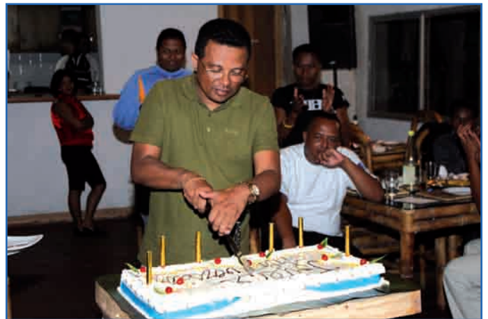
DGT teo am-pandiana mofomamy

« 30 Martsa 2012, mankalaza ny fahatelo taona nitondrany Atoa Orlando ka tonga manotrona azy ny TG Ambositra na dia programa tampoka sy tsy nampoizina aza. Nahafinaritra hatrany ny fiarahana taminy hatrizay na fony izy mbola tsy DGT aza. Samy tanora rahateo ary izaho no anisan'ny tena faly nandefa « message » ho azy tamin'ny nahavoatendry azy ho DGT. Ny tena mampivavaka azy dia izy tsy dia manava-tena loatra fa afaka miaraka amin'ny mpiasa rehetra. Mirary soa ho azy hatrany, enga anie izy haharitra eo amin'ny toerany ary manohana azy foana ny namana TG mpiara-miasa. Maniry ny mbola hiara-hiasa maharitra aminy ihany koa. Hita rahateo moa fa