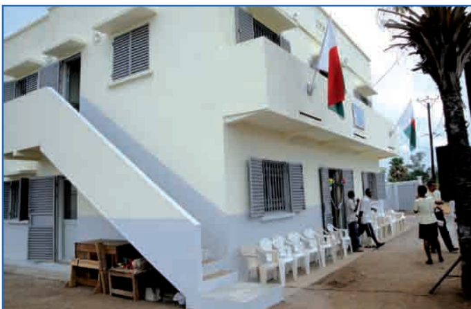
La PP Mitsinjo lors de son inauguration en Décembre 2010