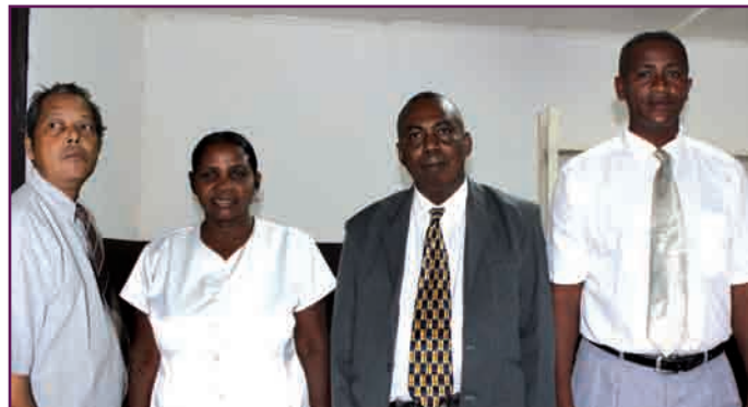
Le personnel de la PP Vangaindrano

de s'approvisionner auprès de la Trésorerie Générale Farafangana.