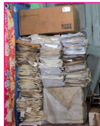
Mivangongo ny antontan-taratasy tahiry