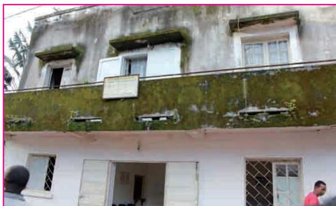
Tsy ampy ny fikojakojana

Marihina fa manana trano iray fonenan'ny mpiasa ny PP Ifanadiana. Nisy mpiasan'ny PP nipetraka tao niaraka tamin'ny fianakaviany. Taty aoriana anefa, nony maty ilay mpiasa dia mbola nonina tao ireto farany. Ankehitriny kosa dia niangavian'ny Tahirim-bolam-panjakana eny an-toerana ny hialandry zareo tao kanefa dia izy ireo indray no mieritreritra ny hitory. Asa na hoana loatra re?