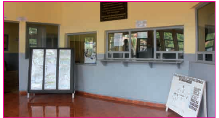
He izany fahadiovany!

Mbola tsapa hatrany anefa ny tsy fahampian'ny toerana sy ny fahaterena koa hisy fotodrafitrasa manokana hatao ho fialofana sy fiandrasan'ireo mpifanerasera eo an-tokontany.