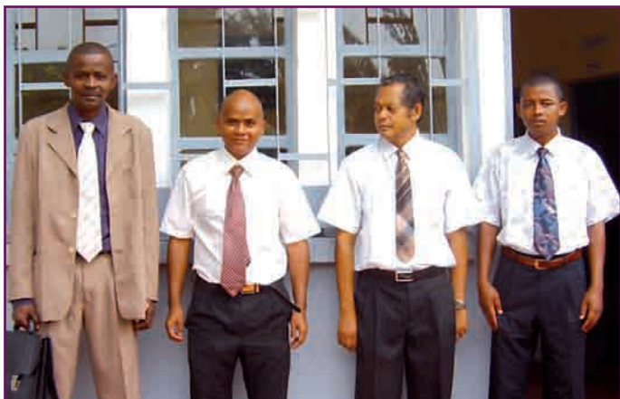
De gauche à droite, MM. PP Befotaka Atsimo, PP Vondrozo, PP Vangaindrano et PP Midongy Atsimo

Malgré ces problèmes, la PP arrive à honorer ses obligations professionnelles même si elle accuse souvent du retard.