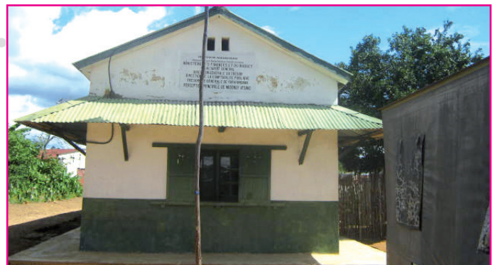
Ny PP Midongy Atsimo ho soloina vaovao

lana ny ao Midongy ary sahirana amin'ny fivezivezena, dia homena moto ihany koa. Mendri-piderana ny mpiasa ao aminy noho fahazo-toany sy ny fandraisany andraikitra satria dia ny « Percepteur » sy ny « garde caisse » irery ihany no mampandeha ny raharaha rehetra ao amin'ity « poste comptable » iray ity.