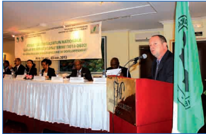
Lors de l'atelier de la BAD à l'hôtel Colbert Antananarenina

L'objectif de l'atelier est de recueillir les avis et idées des participants, sur les stratégies opérationnelles de la BAD en vue de l'adoption, à la fin de l'année 2012, d'une nouvelle stratégie à long terme qui guidera les interventions de la Banque au cours des dix prochaines années. Des éléments nouveaux sont venus alimenter la réflexion à savoir les facteurs culturels, les