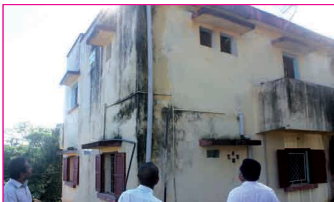
Santionany amin'ireo tsy fahatomombanana