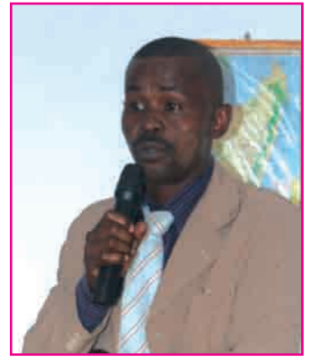
Izy ilay PP mandeha an-tongotra 42 km mandroso, 42 km miverina

Ankoatra ireo, dia hotafoina ny PP Befotaka eo am-piandrasana ny fotodrafitrasa vaovao izay kasaina haorina amin'ny taona 2013 ary hampiana ny mpiasa any an-toerana. Tsara ny manamarika fa hatramin'ny taona 1996 dia mbola tsy nisy fanamboarana mihitsy ity PP ity.