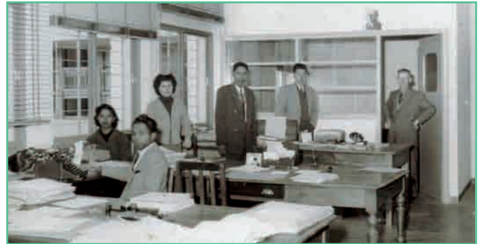
Ireo mpiasa tao amin'ny Paierie Générale fahiny

« Enregistrement et Timbres », ny « Domaines ». Asan'ny Trésor ihany koa ny fandoavam-bola. Ny Trésor no mitahiry ny volam-panjakana ka tomponandraikitra amin'ny vola kirakirainy izy. Tsy maintsy mamarana kaonty isan-taona izy, izay omeny ny « Chambre des Comptes de la Cour Suprême » hotsaraina. Ny mpitan-kaonty foiben'ny Trésor (ACCT) kosa dia mamarana isan-taona ny kaonty tazoniny amin'ny maha mpitam-bola azy amin'ny trosam-panjakana sy ireo kaonty manokan'ny Trésor sady manambatra ny kaonty rehetra faobe ary manao ny « Compte Général de l'Administration des Finances ». Nalefa nodinihin'ny « Chambre des Comptes » izany ka nanao-