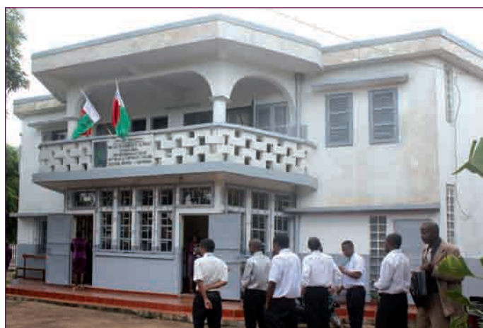
La Trésorerie Générale Farafangana