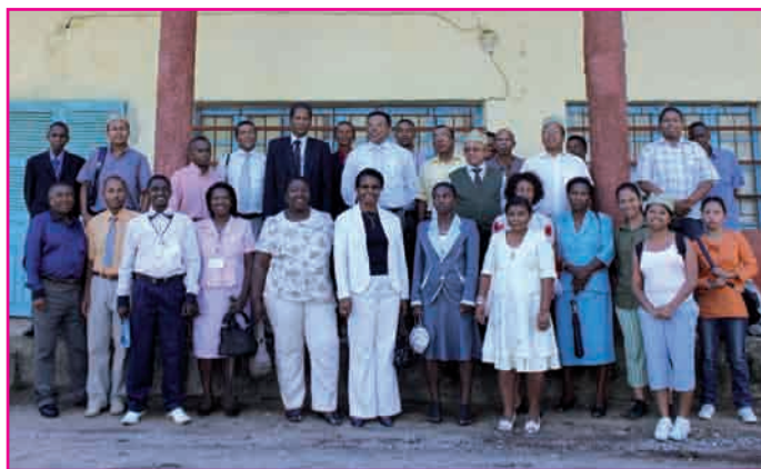
Tsy hadino ny sarim-pahatsiarovana ny fiarahana

trano. Nandray ny andraikiny avy hatrany ny sampan-draharaha misahana ny informatika ary nanome sosokevitra ny hametrahana ireo « unités centrales » rehetra ao anaty efitra iray voaaro amin'ny rivotra sy ny hamandoana. Ao amin'ny TG Manakara no hisantarana izany tetikasa izany ary hararitaka any amin'ireo « postes comptables » rehetra any amorontsiraka.