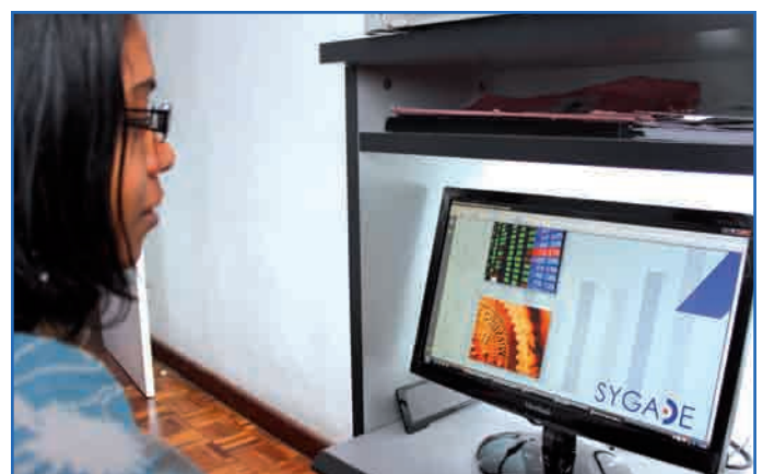
Le nouveau logiciel Sygade version 6.0 utilisé par la Direction de la Dette Publique