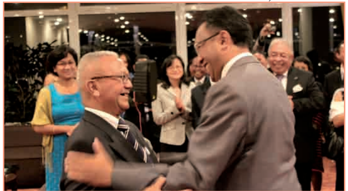
Nankasitrahana an'Atoa DDP amin'ny anaran'ny mpanotroha rehetra ny Minisitry