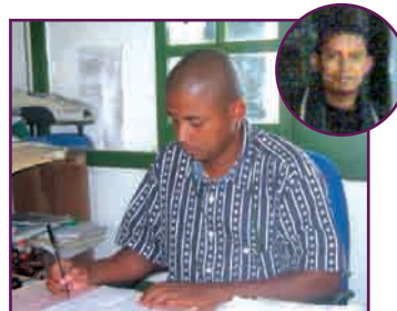
Le PP avec son unique collaborateur (en médaillon)

ral de l'Etat et assignataire des dépenses de la Commune rurale de Midongy Atsimo. Le poste arrive à produire comme il faut les situations périodiques requises. Etant donnée la difficulté du trajet, les approvisionnements de fonds auprès de la TG Farafangana se font trimestriellement.