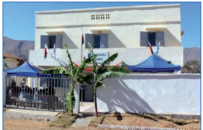
La PP Ikalamavony a été inaugurée le 6 Juillet 2011

de pair avec l'image du Trésor. En 2009, les travaux de construction de la Trésorerie Générale Mahajanga ont été poursuivis, en 2010, les Perceptions Principales Mitsinjo et Ikalamavony ont bénéficié de nouvelles constructions. En outre, cette même année a vu le début des travaux pour la rénovation de la PP Kandrehô. Au cours de l'année 2011, ce fut au tour des PP Amboasary Atsimo, Ankazoa-