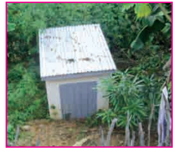
Tsy azo ampiasaina intsony ilay trano fivoahanan'ny PP Vondrozo