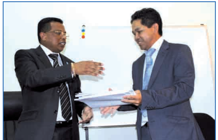
Fifandraisan-tanan'ireo Tale nifandimby toerana

Marihina fa efa nisolo toerana vonjimaika teo amin'ny fitanta-