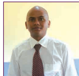
Le Percepteur Principal de Vondrozo

servir des machines à bandes ni des ordinateurs pendant les heures de travail. Ce problème est davantage crucial en période de grand paiement.