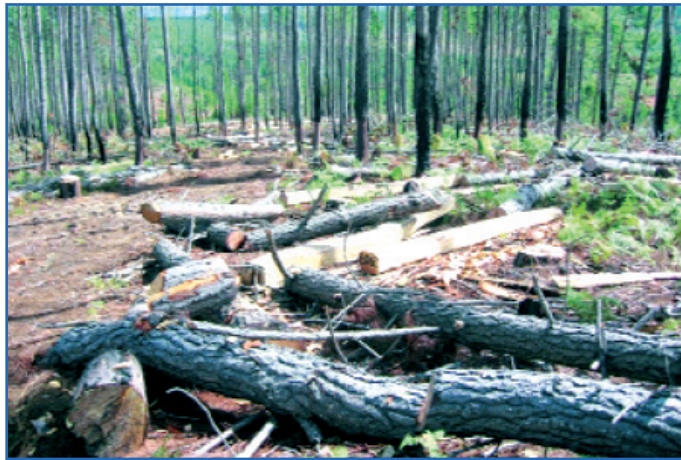
La zone d'exploitation de Fanalamanga

La société Fanalamanga est au centre de toutes les attentions depuis quelques semaines. Rappelons que l'affaire Fanalamanga a débuté suite à la prise par le Ministère de tutelle technique d'un arrêté pour le remplacement de l'Administrateur Général de l'époque, cela sans en informer au préalable les actionnaires. La décision est contestée, et l'affaire prend très rapidement une tournure politique impliquant à la fois des membres du Conseil Supérieur de la Transition, du Congrès de la Transition et du Gouvernement. Est-ce une incompétence du Ministère de tutelle technique? Dans la mesure où il a pris un acte de Gouvernement, organe de l'Etat pour une mesure concernant une société anonyme régie par le droit des sociétés. Ou est-ce une méconnaissance de la Loi sur les sociétés commerciales? Ou encore une précipitation dans la prise de décision? Et surtout dans quel but? Quoi qu'il en soit, l'arrêté en question est illégal et ridicule. Le Trésor Public ne veut plus être complice des mauvaises pratiques qui ont conduit la plupart des sociétés à participation de l'Etat en faillite. En effet, seuls les actionnaires, apporteurs de capitaux, ont le pouvoir de révoquer l'Administrateur Général d'une société anonyme, et le Ministère de tutelle technique n'a jamais été, et ne pourra jamais être actionnaire de Fanalamanga SA, contrairement aux fausses idées véhiculées