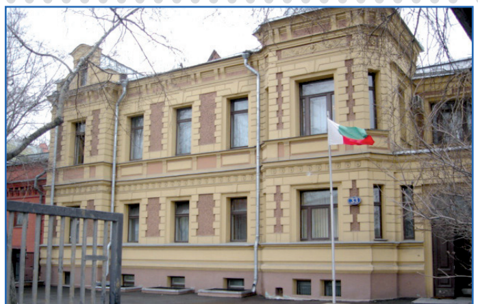
Ny masoivohon'i Madagasikara any Moscou (Rosia)

Ireto no taranja hanadinana an-tsoratra : «Comptabilité de l'Etat, Finances Publiques, Connaissances générales, Correspondances administratives». Ny adina am-bava kosa dia hitsapana ny fahalalan'ny kandida momba asa, kolontsaina, fahalalana ankapobeny ary ny informatika...».