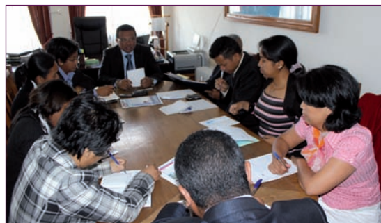
Réunion de 1 ère lecture du Comité de rédaction