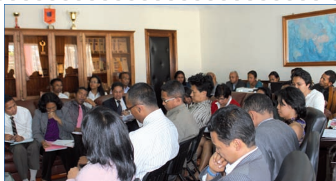
Réunion des responsables budgétaires du Trésor Public (2)

d'une démarche qualité, suite à l'adoption d'une politique de Gestion Axée sur les Résultats, initiée par le Trésor Public depuis 2010. Effectivement, en 2012, le Trésor Public renforcera la démarche qui maximise la qualité de ses prestations en tant que service public d'une part, et renforcera la sécurisation des sites de conservation, des transports et des mouvements de fonds, et du personnel d'autre part. En outre, certains aspects de ses interventions et de ses actions seront réorientés vers