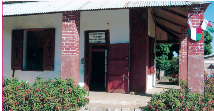
Ny Biraon'ny PP Betroka

Eo amin'ny lafiny fandriampahalemana indray dia anisan'ny faritra mena i Betroka satria betsaka tokoa ny dahalo ary mirongatra ny halatra omy. Mahafa-po tateraka ny fiaraha-miasa amin'ny mpitandro filaminana hoy Atoa PP satria manampy azy ireo tokoa ny zandary amin'ny fiambenana ny trano sy ny fitaterana ny vola.