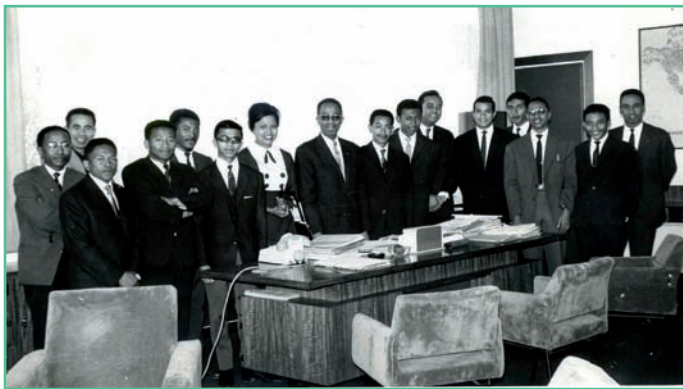
Ny solontenan'ny mpiasan'ny Trésor niarahaba tratry ny taona an'Atoa Victor Miadana, Minisitry ny Fitantanam-bola (1967)