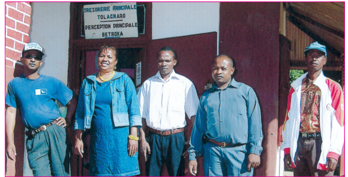
Atoa PP (faharoa ankavanana) sy ireo mpiara miasa aminy

asa izany ka tokony hitadiavana vahaolana maharitra. Tsy misy intsony kosa ny olana ara-pitaovana satria efa nahazo ny anjarany ny PP nandritra ny fandalovan'ny iraky ny Foibem-pitondran'ny Tahirim-bolam-panjakana tany amin'ny Faritra Anosy. Vita tsara ihany koa ny asa satria miisa dimy ireo mpiasa ao amin'ny PP Betroka.