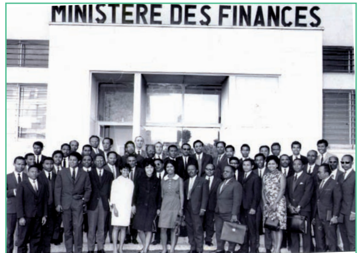
Ireo mpiasan'ny Trésor tamin'ny taona 1967

ireo anefa dia maro no nitana andraikitra ambony tao amin'ny Foibem-pitondrana.