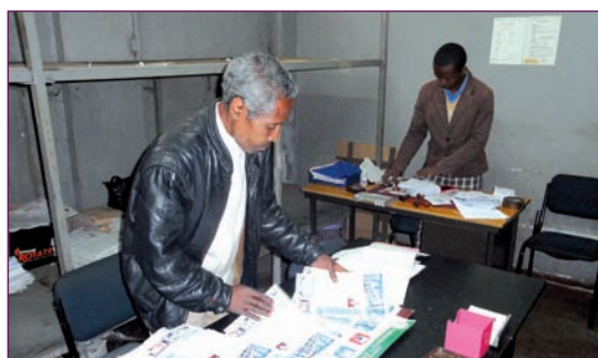
Tahir s'appuie sur le réseau comptable du Trésor Public pour sa distribution