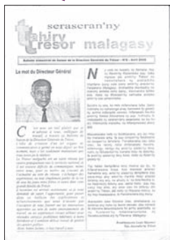
L'ancêtre du bulletin Tahir

L'idée de création d'un outil de communication au sein de la Direction Générale du Trésor a certes