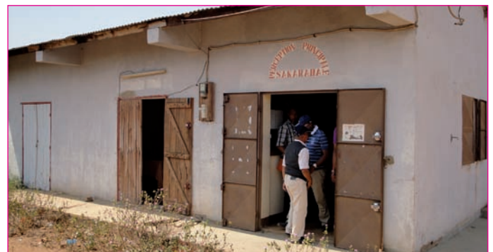
Ny tranon'ny PP Sakaraha

Eo amin'ny lafiny fotodrafitr'asa indray dia miandry ny fanamboarana toerana fidiavana vaovao, araka ny nampanantenana azy ny PP Sakaraha. Efa ratsy, simba ary tsy azo ampiasaina intsony ny andry zareo ankehitriny. Rehefa nanontanianay mikasika ity toe-javatra ity ny tompon'andraikitra ao amin'ny Foibem-pitondran'ny Tahirim-bolam-panjakana dia nambarany fa tsy mbola vita ara-dalàna ny fikarakarana ny toerana hanangana io fotodrafitr'asa io ka izany no antony