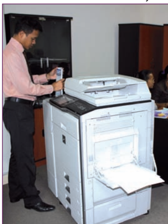
Tahiry est une autoproduction de la Direction Générale du Trésor

En un mot, il ne laisse pas indifférent ses lecteurs pour une raison ou une autre. Pour preuve, des quotidiens nationaux de renommée rapportent régulièrement dans leurs colonnes des informations ou analyses