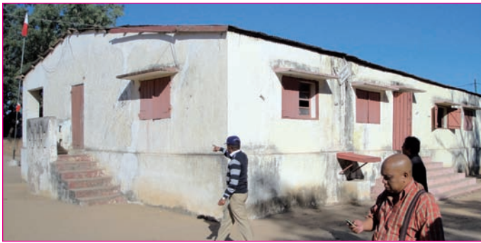
Tranainy tokoa ny trano iasan'ny PP Amboasary Atsimo amin'izao fotoana izao

F antatra tamin'ny tapaky ny volana septambra lasa teo ny orinasa voafidy hanorina ny trano vaovaon'ny Perception Principale any Amboasary Atsimo. Efa nidina any an-toerana ny mpiasa hanatanteraka izany asa izany, izay hanomboka tsy ho ela intsony. Volana maromaro lasa izay no efa vonona ny tany natolotry ny Kaominina Amboasary Atsimo hanorenana azy. Ao amin'ny fokontany