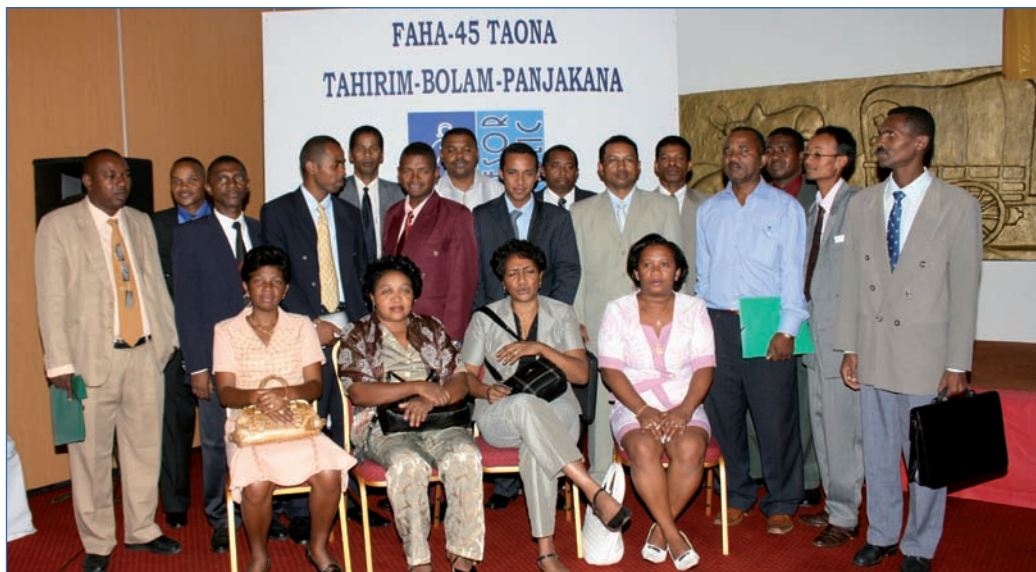
Les Trésoriers Généraux et Trésoriers Principaux au grand complet lors du 45 ème anniversaire du Trésor

Dans un premier temps, huit postes comptables supérieurs sont concernés. Un Inspecteur du Trésor a été promu Trésorier Général et un autre