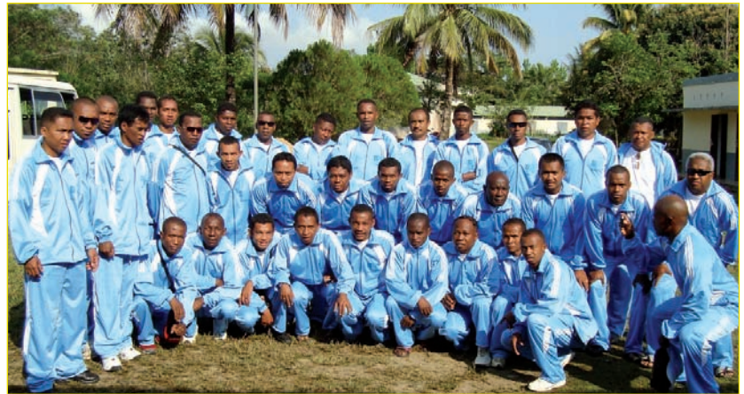
Ireo mpilalao baolina kitra ekipan'ny Trésor mixte tany Fénérive-Est