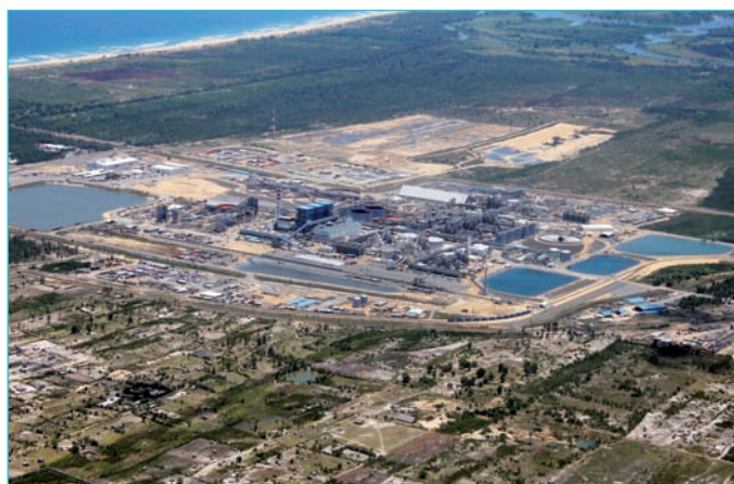
Vue aérienne du site d'Ambatovy

BT: Voyez-vous, les compagnies actionnaires, les banques prêteurs d'Ambatovy et l'ensemble des par-