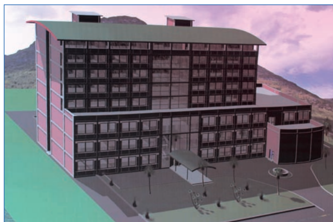
Le futur bâtiment de l'INSCAE

Le délai de réalisation des travaux est de 14 mois. Il est à noter que le démarrage du projet a été retardé