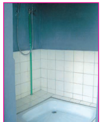
Manara-penitra ny trano fidiovana

ny fanaovana «approvisionnement» handovana ny karaman'ny mpiasam-panjakana sy