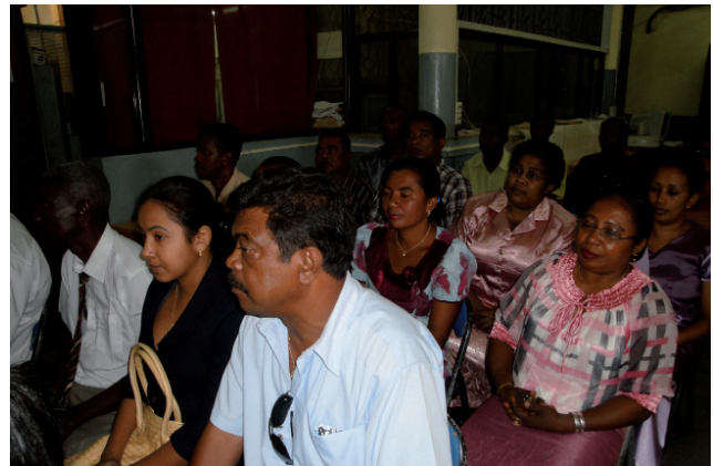
Ireo mpiasan'ny TG Toliara, nandritra ny dimidinika nifanaovana tamin'ny tompon'andraikitra avy aty amin'ny Foibem-pitondrana

Mpiasa anankiray tao Fianarantsoa no nilaza fa mandrak'ankehitr'io dia mbola tsy voavaha foana ny olany momba io fiakaran'ny mari-karama io noho ny afitsokin'ny mpiasa sasantsasany eo anivon'ilay sampan-draharaha voalaza etsy ambony io. Efa tamin'ny taona 2005 no name-trahany ny fangatahany nefa mbola tsy misy tohiny foana izany hatramin'izao. Miahiaty be ihany izato farany satria efa nanao izay tratry ny heriny izy tamin'ny famahana ny olana nefa toa herim-po very maina ihany ny azy satria mbola tsy