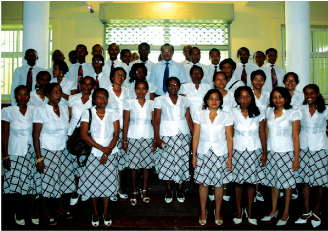
Ireo mpiasa ao amin'ny Trésorerie Générale ao Mahajanga

manara-maso fotsiny anefa fa mikaroka ihany koa ny hevitra ahatratarana ny tanjona. Anjan'ireo tompon'andraikitra ireo ny mandrafitra an-tsoratra ny tatitra momba ny asa vita isan-telovolana.