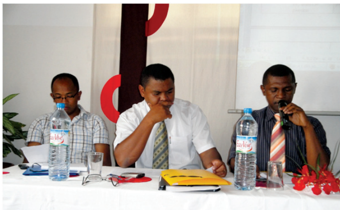
Quelques membres des quatre commissions

Durant les trois jours de rencontre, quatre thèmes principaux ont été abordés, à savoir la réforme des textes, la nomenclature des pièces justificatives, les comptes définitifs et les relations de travail entre la DCP et les postes comptables..