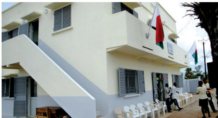
Trano vaovaon'ny PP Mitsinjo