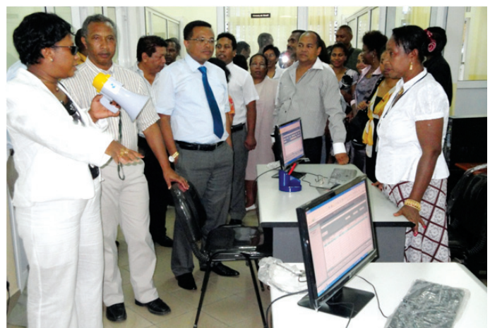
Ny Tale Jeneraly mitafa amin'ny mpiasa