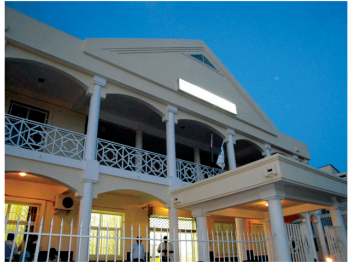
Ny Trésorerie Générale ao Mahajanga

Nifanarahana mazava tsara fa isaky ny telovolana, dia misy ny tomban'ezaka ataon'ireo tompon'andraikitra ireo miaraka amin-dRamatoa Trésorier Général; ao no itadiavana vahaolana ho an'ireo tanjona tsy tratra ary ifanoroana hevitra koa hanatsarana hatrany ny efa vita. Isaky ny enim-bolana kosa, dia misy ny tomban'ezaka atao anaty fivoriam-be iarahana amin'ny mpiasa rehetra, mandray anjara fitenenana ny tsirairay mandritra io fotoana io milaza ny olana misy eo amin'ny fanatanterahana ny asany sy manome soso-kevitra