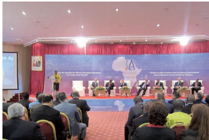
Cinquieme Conférence Économique Africaine, Tunis, 27 au 29 octobre 2010

ka, Président de la BAD a déclaré que l'Afrique a connu, au cours de la dernière décennie, une progression particulièrement forte que la crise a quelque peu freinée, mais pas inversée. Il a fait observer que la croissance doit être durable et non éphémère, en rappelant que l'effet conjugué de divers facteurs avait anéanti des acquis similaires