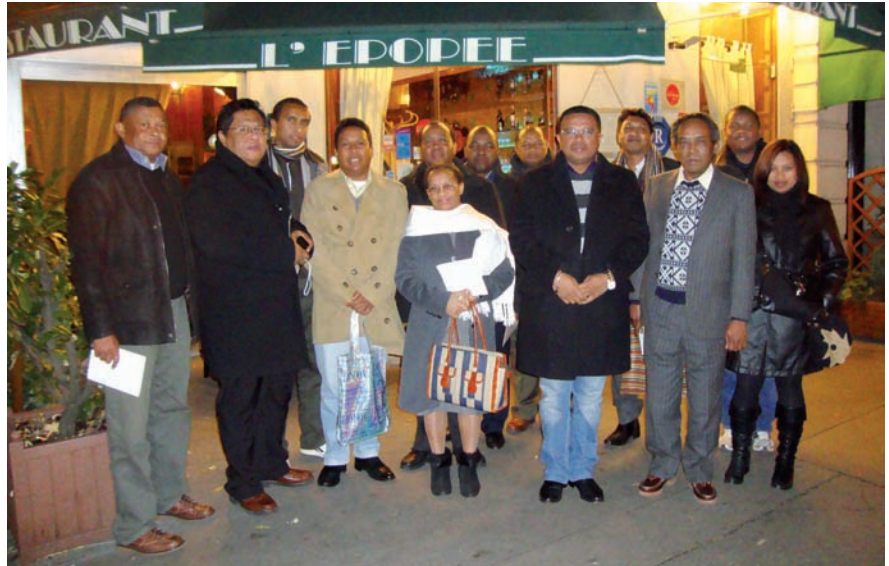
Ireo Agents Comptables miaraka amin'ny Tale Jeneraly sy ny Talen'ny Fitana kaontim-panjakana

fihonana ity ny nanome fanazavana mikasika ny "Budget de Fonctionnement" ho an'ny masoivoho any ivelany. Nambarany fa ny Ministeran'ny Raharaham-bahiny no mamolavola sy mitsinjara ny sora-bolan'ireo masoivoho any ivelany. Tsikaritra anefa fa izay sora-bola teo aloha ihany foana no miverina rehefa manao ny teti-bola manaraka, izay matetika tsy mifanaraka amin'ny vinavinampandaniana takian'ny soritrana natolotra. Izany tranga izany no mahatonga ny olana eo amin'ny fampandehanan-draharaha eo amin'izy ireo.