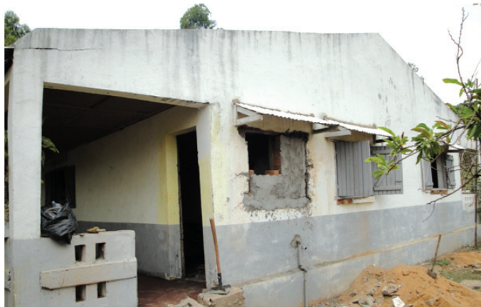
Tsy mahitsy ny tolanam-baravarana, mivilana ny rindrina

Tranga fahita any amin'ny faritra eto Madagasikara ny fanorenana-trano tsy manara-penitra. Manoloana izany dia handray fepetra hentitra ny Foibem-pitondran'ny Tahirim-bolam-panjakana. Manomboka izao dia hofafana tsy mahazo mifaninana sy manatanteraka asa intsony ireny orinasa nanao tsirambina ka mambotry firenena ireny. Hohamafisina ny fanaraha-maso ny asa vita ka hojerena na manara-penitra izany na tsia. Tsy ekena ihany koa fa hasaina mamerina manotolo ny asa izay orinasa tsy manatanteraka ny fepetra takiana aminy.