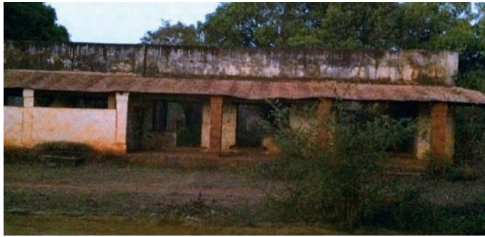
Ny tranon'ny Perception Principale taloha

fiara dia voatery manofa sarety na moto ny Percepteur isaky ny handeha haka vola handoavana ny karaman'ny mpiasam-panjakana sy ireo mpandray fisotroan-dro-