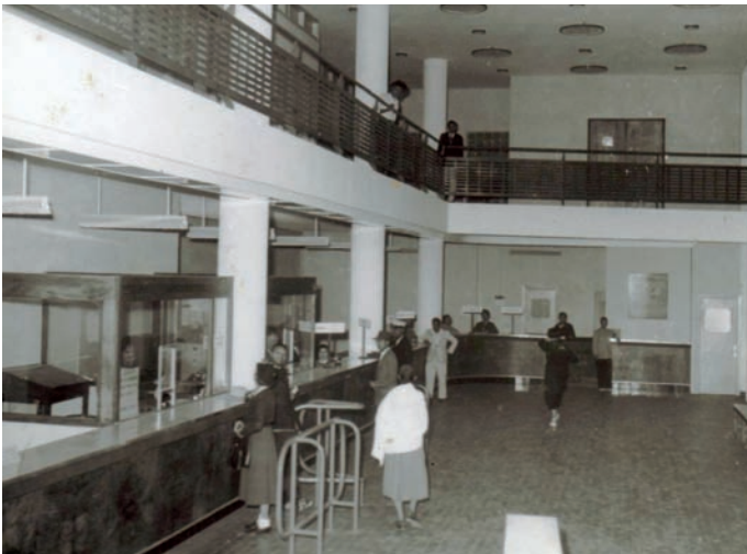
Anatin'ny Paerie Générale d'Antananarivo, taona 1955

mahasoa ny be sy ny maro ny zanatany tamin'izany fotoana izany. Nanaraka izany koa ny andraikitra nomena ny sampan'asa momba ny Tahirim-bolam-panjakana.