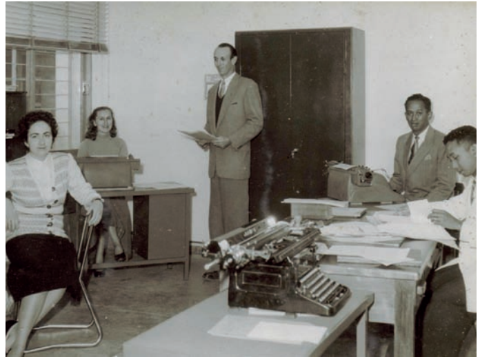
Ny mpiasan'ny Trésor tamin'ny taona 1950

Niparitaka tsikelikely nanerana an'i Madagasikara ny sampan'ny Trésor izay nitondra ny anarana hoe « Paeries ». Tsy fanaparahana ara-jeografia fotsiny anefa fa fanaparahana andraikitra ihany koa, satria ny Trésor no mitantana ny volan'ny