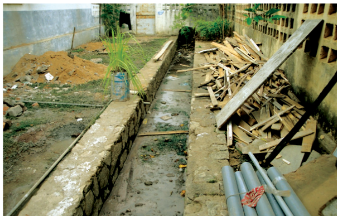
Tsentsina ny tatatra fivoahan'ny rano maloto