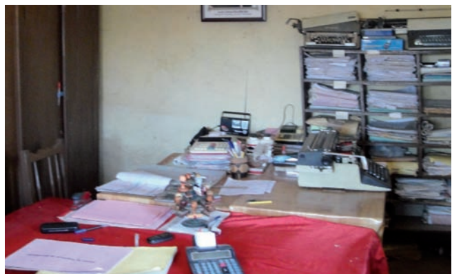
Ny Birao nisehoan'ny fanodinkodinam-bola

Tsy nionona tamin'ny fanodinkodinam-bola anefa io tompon'andraikitra io fa mba entina hanadiovana ny tenany tamin'ny fahaverezam-bolam-panjakana dia nanao taratasy isan-karazany izy entina hanamarinana ny tsy naha teo an-toerana azy tamin'ny fotoana nanatanterahana ny fisafoana, toy ny taratasy manamarinana ny fidirana hopitaly, sns... Rehefa natao anefa ny fanadihadiana dia hita ihany koa fa hosoka avokoa ireny taratasy nalefany taty amin'ny Foibem-pitondran'ny Tahirim-bolam-panjakana ireny. Ankoatr'izay, dia mbola niezaka ihany koa izy nanakorontana sy na-