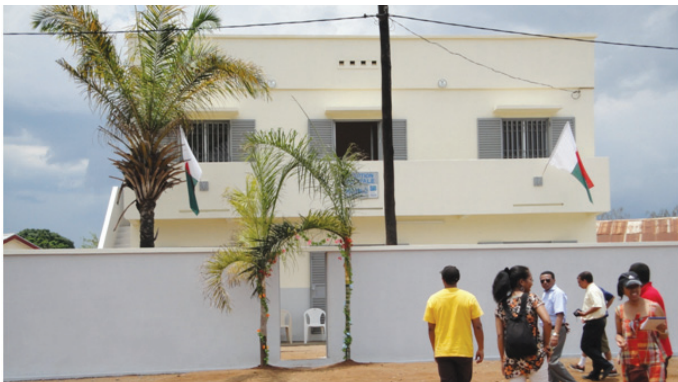
Ny Perception Principale amin'ny endriny vaovao

pian'ny kaominina sy ny distrika tany an-toerana, teo amin'ny fanamboarana ny antontan-taratasy rehetra momba ny tany.