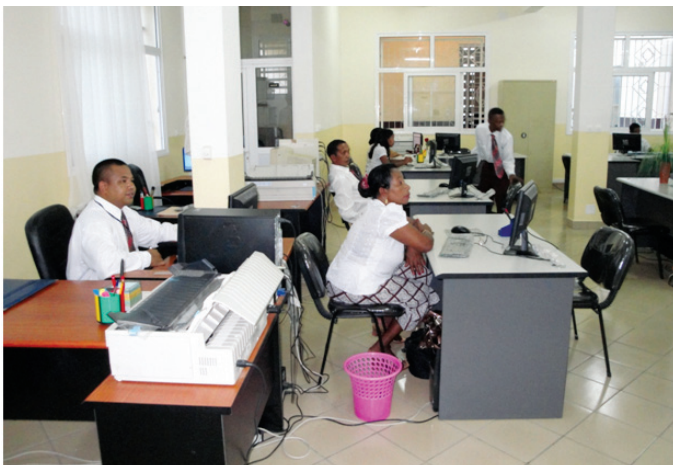
Malalaka sady arifomba ny birao vaovao