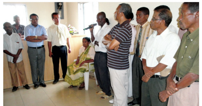
Ny solon-tenam-panjakana nanatrika ny fitokanana

any an-toerana. Nanotrona izany koa ny iraka avy aty amin'ny Foibem-pitondran'ny Tahirim-bolampanjakana. Tsy nahasakana ny dele-