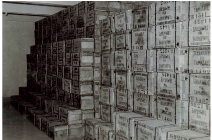
Ireo antontan-taratsin'ny Trésor naporitaka nanerana an'i Madagasikara. Jereo izany filaminany

Mbola hitohy amin'ny Tahiry laharana fahatelo ny fanaparahana ny Sampan'asan'ny Trésor.