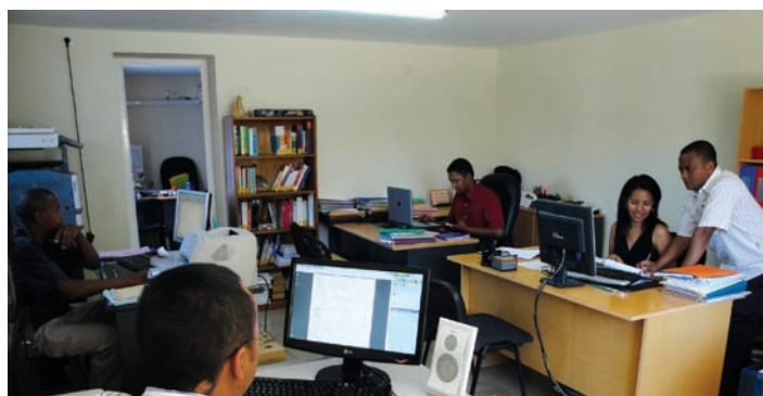
Ireo mpiasa ao amin'ny Direction des Etudes

Cinquieme Conférence Économique Africaine P.15