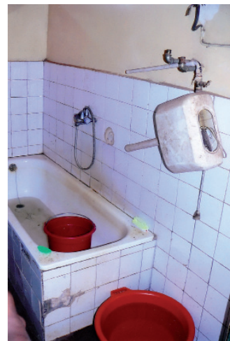
Simba ka mila fanamboarana ny efitrano fidiovana

Nandritra ny fotoana nandalovan'ny iraky ny foibem-pitondran'ny Tahirim-bolam-panjakana tany amin'ny faritra Matsiatra Ambony iny dia nisy ny fepetra noraisina mba hamahana avy hatrany ny olana. Hividiana sinibendrano ny Perception Principale ao Ambalavao Tsiemparihy mba hialana amin'ny fivezivezena sy ny fahasahirana be loatra. Nisy ny