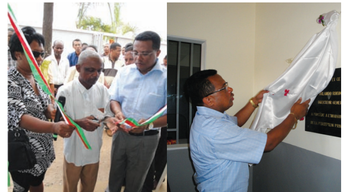
Ny fanapahana "ruban" sy fanokafana ny takela-pahatsiarovana