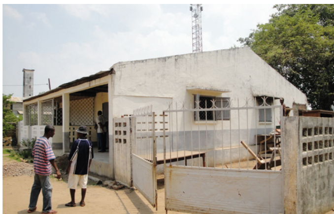
Ny Perception Principale ao Mampikony

desambra taona 2008 dia efa nisy fanavaozana ny trano kanefa simba sahady roa taona taty aoriana. Betsaka ny lesoka hita : Mivilana sy tsy mety mihidy ny varavarana sy ny varavarankely, tsy mahitsy tsara ny rindrina, vailanina ny valin-drihana.