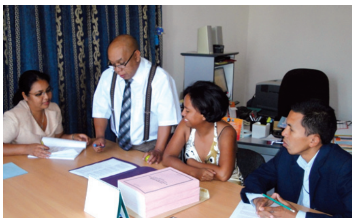
Le Directeur des Etudes et son staff