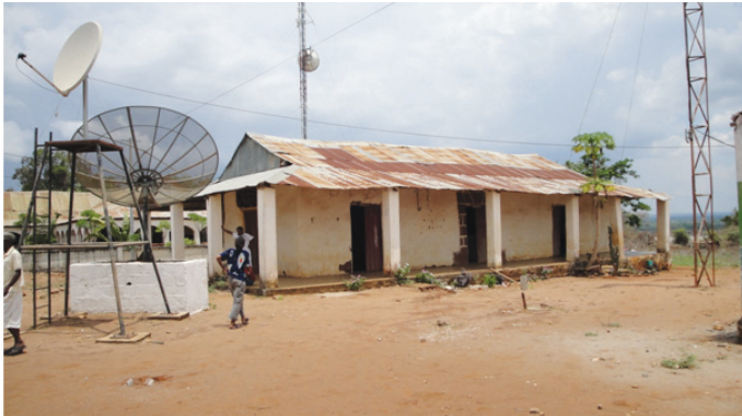
Ny Perception Principale teo aloha