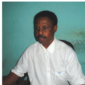
Fondé de Pouvoir TP Nosy Be

Izy no nitantana ny Trésorerie Principale tao Nosy Be nandritra ny krizy. Voatendry ho Trésorier mpisolotoerana izy tamin'ny 1 Mars 2002 ka hatramin'ny 1 Jolay 2003.