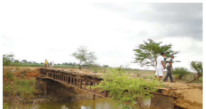
Toy izao ny lalana mankany Mitsinjo

gasiona nitsidika tany an-toerana ny haratsin'ny lalana sy ny fiampitana bac.