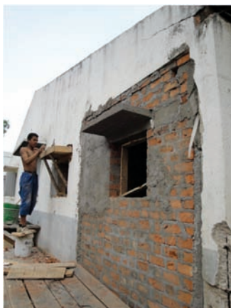
Sarotra ny fanarenana ny asa tsy manara-penitra

Hatrany am-boalohany dia hita fa tsy araka ny tokony ho izy ny nanorenana ny trano. Tamin'ny volana