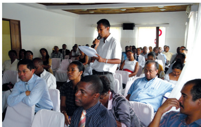
Les participants à l'atelier de Mahajanga

Trois principaux points ont été abordés à ce sujet : la gestion