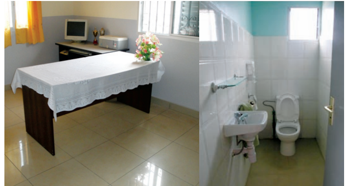
Manara-penitra ny birao sy ny efitrano fidiovana

Tomombana ny zava-drehetra ao an-trano sy ivelany. Vy avokoa ny