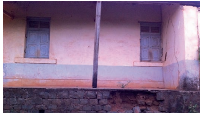
Ny tranon'ny Perception Principale ankehitriny

Lasa manofa trano ny Percepteur Principal ao Tsaratanana satria nalan'ny Lehiben'ny Distrika tao amin'ny tranom-panjakana nitoe-rany izy. Nomarihany anefa fa tao