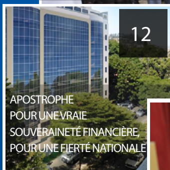
APOSTROPHE POUR UNE VRAIE SOVERAINETÉ FINANCIÈRE, POUR UNE FIERTÉ NATIONALE