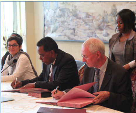
La partie malgache a été représentée par le Ministre des Finances et du Budget

Le Gouvernement français, à travers l'Agence Française de Développement (AFD) a confirmé le financement de 25 millions d'euros sous forme de subventions non remboursables de cinq projets au profit de la population malgache. La cérémonie de signature des cinq conventions entre l'AFD et la République de Madagascar, s'était tenue au Ministère des Affaires Etrangères le 16 juin 2014. A noter que l'AFD a toujours appuyé Madagascar même durant la crise, et pour preuve, durant l'année 2013, l'agence nous a soutenu à hauteur de treize millions d'euros.