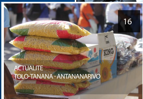
ACTUALITE TOLO-TANANA - ANTANANARIVO