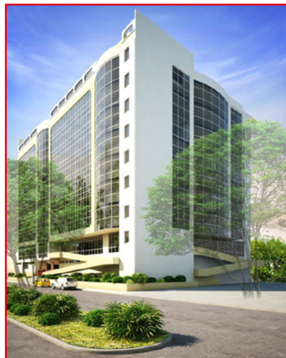
Le nouveau bâtiment du Trésor Public malgache trônant à Antananarenina... dans moins de cinq ans si...

Pour une vraie souveraineté financière, Pour une fierté nationale