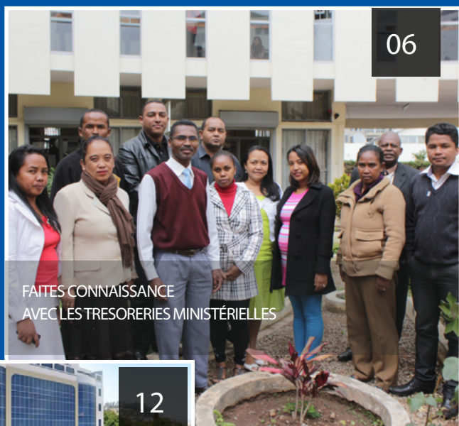
FAITES CONNAISSANCE AVEC LES TRESORERIES MINISTÉRIELLES