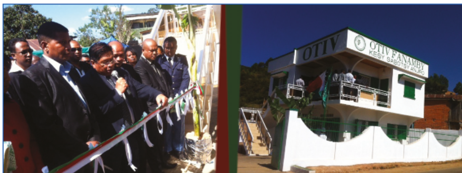
Les services des IMF s'étendent

En somme, la Direction Générale du Trésor (DGT), organe de tutelle travaille, de concert avec les partenaires techniques et financiers et les IMF – le noyau dur du secteur de la