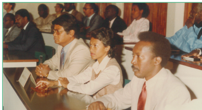
Tao amin'ny Hotel TERENGA (Dakar) no nanaovana ny fivoriana

Nandritra ny vanim-potoanan'ny Repoblika Voalohany dia nifantoka tanteraka tamin'ny andraikitra fototra teto an-toerana ny Trésor Malagasy. Raha ny teo amin'ny lafiny fifandraisana iraisam-pirenena dia ny fiaraha-miasa tamin'ny Frantsay hatrany no tena nisongadina sy nohamafisina. Tsy nisy loatra ny fifanakalozana tamin'ny firenena hafa ankoatra an'i Frantsa.