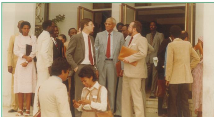
Noraisin'ny Ministry ny Raharahambahiny Senegaley ny solontena malagasy

Afaka dimy volana dia anjaran'ny Tahirimbolam-panjakana malagasy no mandray ny fivoriamben'ny fikambanan'ny Trésor maneran-tany (Association Internationale des Services du Trésor, AIST). Efa tamin'ny taona 1979 no nisy ny fivoriana voalohany saingy tamin'ny fivoriana faharoa, tamin'ny taona 1984 kosa no nandray anjara voalohany ny Trésor malagasy.