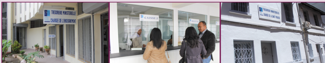
Les TM sont abritées par les ministères dont elles ont la charge. Le Trésor Public équipe le local pour qu'il soit conforme aux normes

Actuellement, trois de ces postes comptables spécialisés sont opérationnels. Faites connaissance avec les Trésoreries Ministérielles (TM).